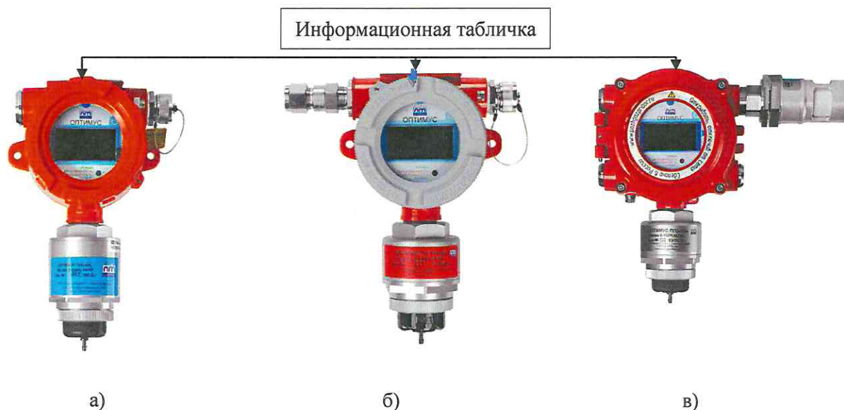
Рисунок 1 – Общий вид газоанализаторов: а) газоанализаторов, произведенных до 2023 г., б) газоанализаторов, произведенных после 2023 г. – корпус с 3-мя вводными отверстиями, в) газоанализаторов, произведенных после 2023 г. – корпус с 5-ю вводными отверстиями